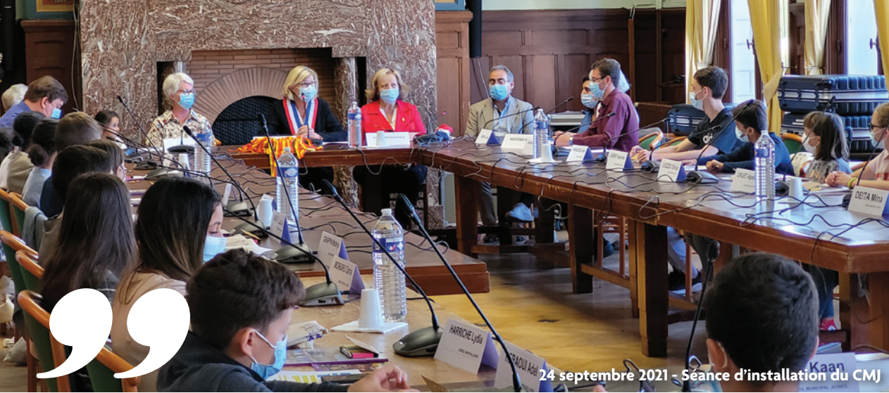
24 septembre 2021 - Séance d'installation du CMJ