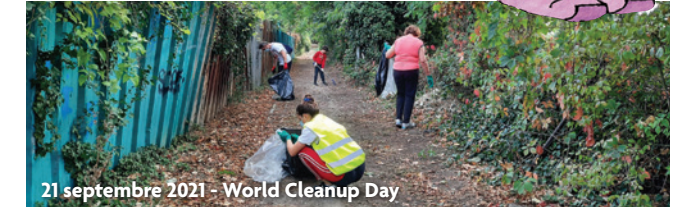
21 septembre 2021 - World Cleanup Day