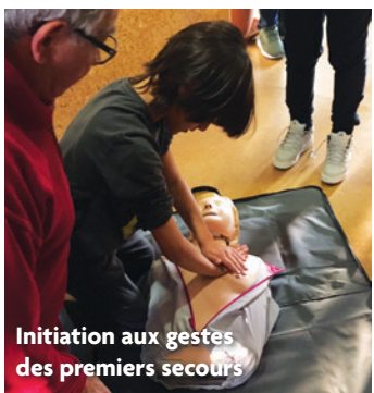
Initiation aux gestes des premiers secours