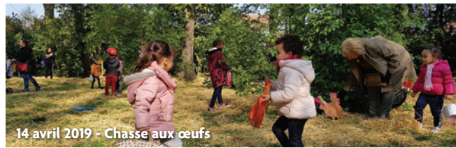
14 avril 2019 - Chasse aux œufs