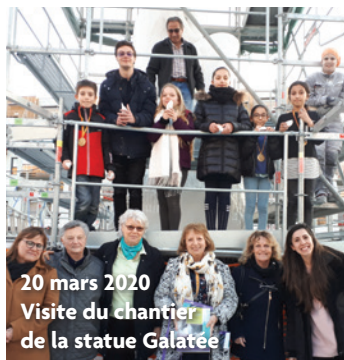
20 mars 2020 Visite du chantier de la statue Galatée