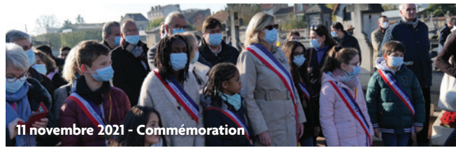
11 novembre 2021 - Commémoration