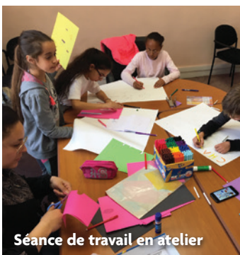
Séance de travail en atelier