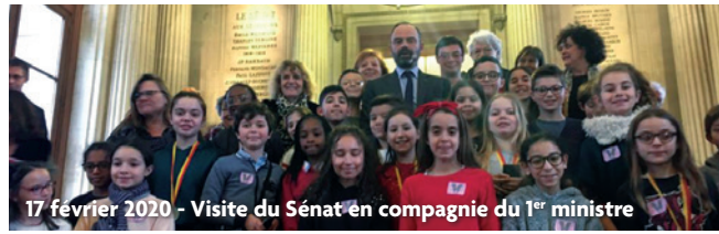
17 février 2020 - Visite du Sénat en compagnie du 1 er ministre