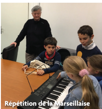
Répétition de la Marseillaise