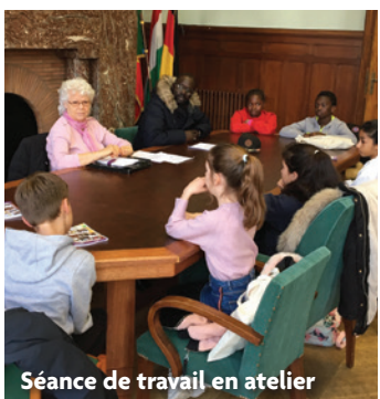
Séance de travail en atelier