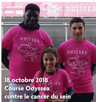
18 octobre 2018 Course Odyssea contre le cancer du sein