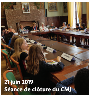
21 juin 2019 Séance de clôture du CMJ