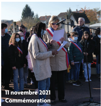
11 novembre 2021 Commémoration